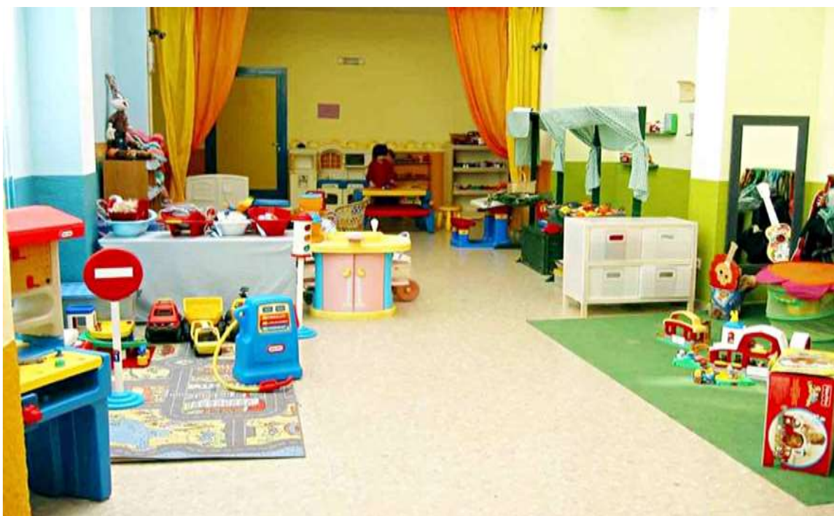
Imagen extraída de: