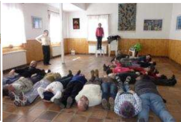
Dinámica "Lata de sardinas"