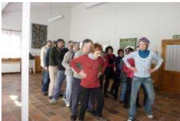
Danza de Ramón (Tatjana, Cantabria)