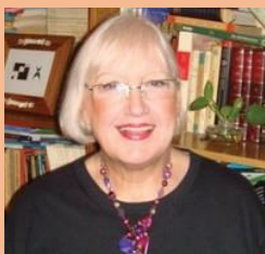
Ilustración de Sara Sedrán

Propuesta: Recuerda el último circo que viste y lo que más te gustó. Hay muchos personajes en el circo. Puedes elegir uno de ellos y dibujarlo y hasta hacer una descripción o una poesía.